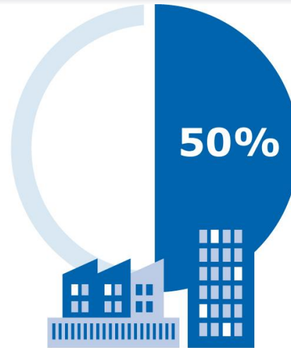
DLA ŚREDNICH FIRM